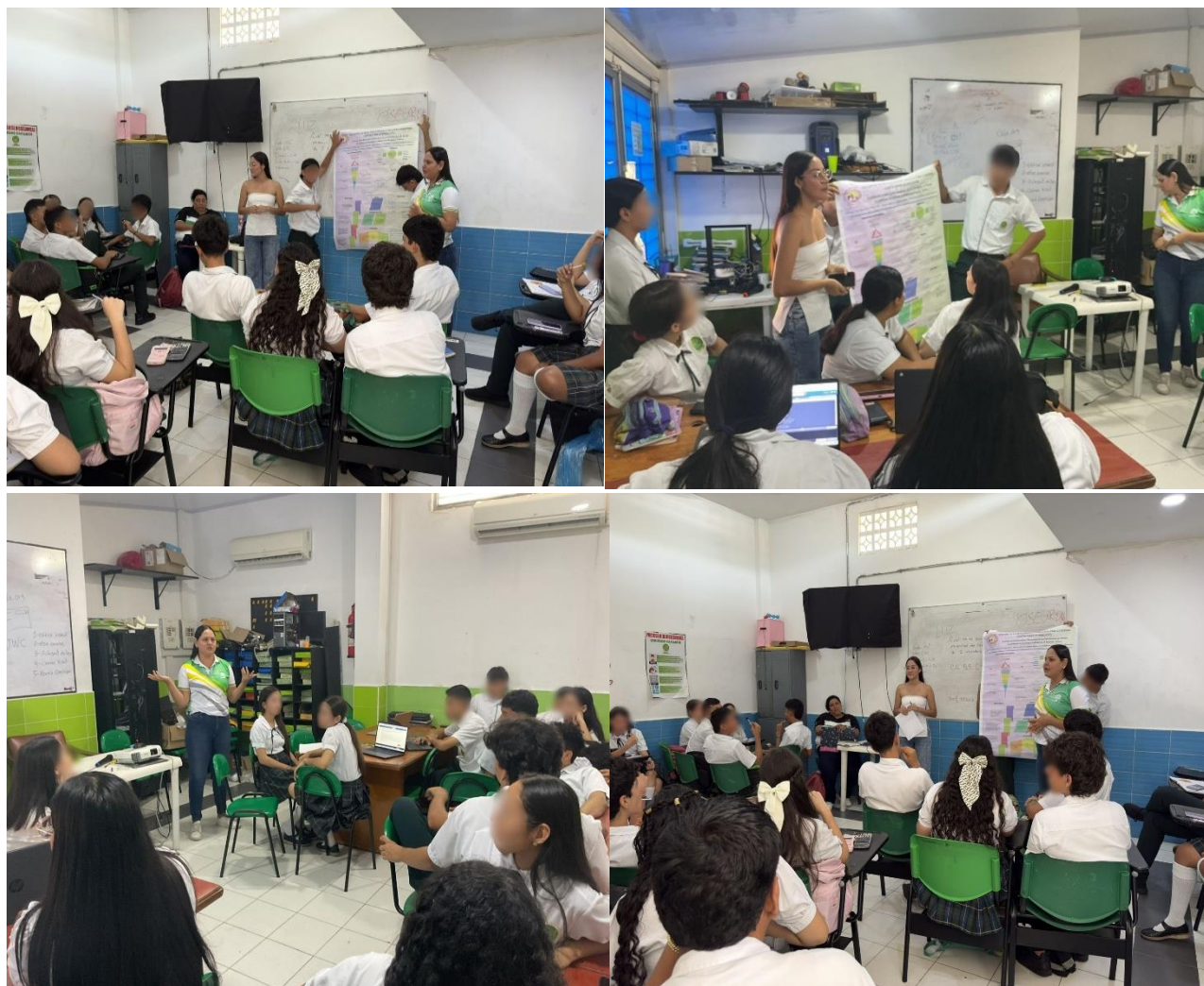
Ilustración Presentación del proyecto de investigación educación financiera con los estudiantes de media académica del colegio Cafasur

“EDUCACIÓN SUPERIOR CON CALIDAD PARA TODOS”